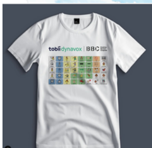
Camiseta. Tobii Dynavox