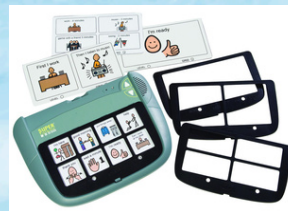
Super talker