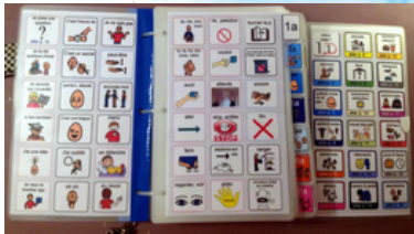
Cuaderno PODD en papel.