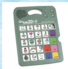
Go talk