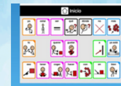
Comunicadores dinámicos con software robustos